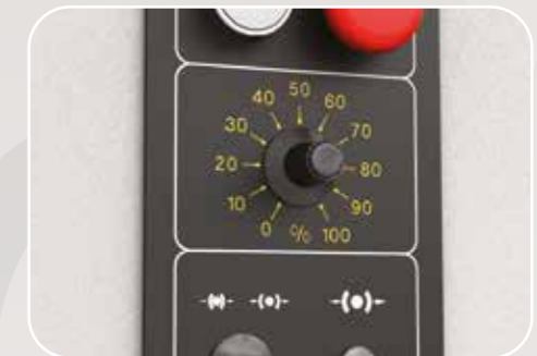
Inverter 3,5 ÷ 8 m/s Inverseur 3,5 ÷ 8 m/s Inverter 3,5 ÷ 8 m/s Wechselrichter 3,5 ÷ 8 m/s Inversor 3,5 ÷ 8 m/s