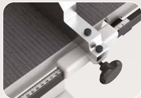
Squadro con riga millimetrata Guide avec échelle graduée Fence with graduated scale Anschlag mit Millimeterlinie Guía con escala graduada