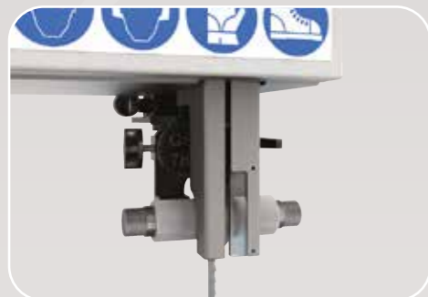
Guidalame superiore di alta precisione Guidalame supérieur de haut précision High-precision top blade guide Hochpräzisions obere Blattführung Guía-sierra superior de alta precisión