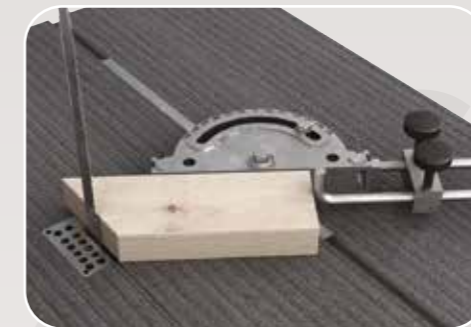
Piano scanalato con squadro per tagli angolari Table rainurée avec guide pour coupes angulaires Grooved table with mitre fence Tisch mit Nute und Anschlag für Winkelschnitte Mesa con ranura y guía para cortes angulares