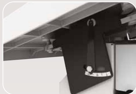
Sistema di inclinazione ergonomica del piano Dispositif de inclinaison ergonomique de la table Ergonomic tilting table device Ergonomische Kipptisch Gerät Sistema de inclinación ergonómica de la mesa