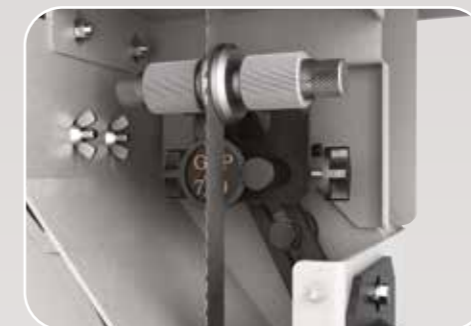
Guidalame inferiore di alta precisione Guidalame inférieur de haut précision High-precision bottom blade guide Hochpräzisions obere Blattführung Guía-sierra inferior de alta precisión