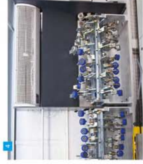
4 Soğutma Kabini Cooling Unit