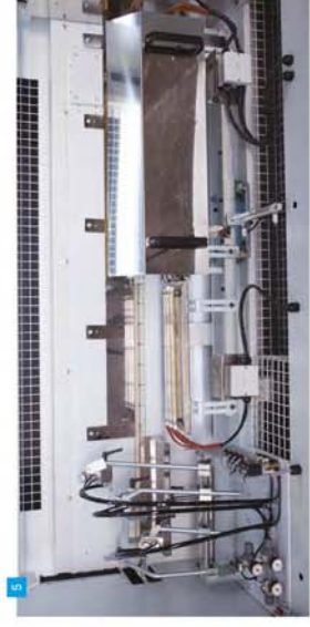
5 PVA Tutkal Püskürtme ve Isıtma Sistemi PVA Glue Spray and Heating System