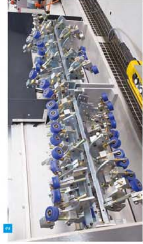
2 Form Bacakı Forming Pips