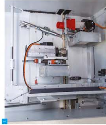
1 Ador ve Laminant Frens Surface and Laminate Milling