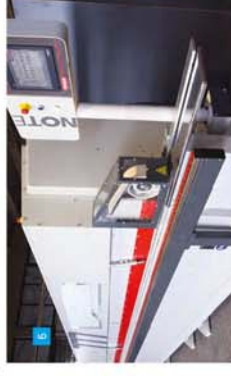
6 Kayış Sistem Belt System PLC Dokunmatik Ekran PLC Touch Screen