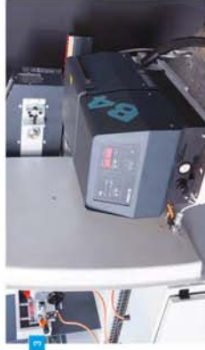
3 Hot Melt Tutkal Ünitesi Hot Melt Glue Unit